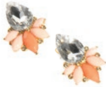
Sehnsucht nach Romantik: zarte, pastellige Ohringe von PIECES