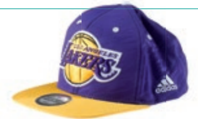
Lakers sind Kult: Baseball Cap von ADIDAS