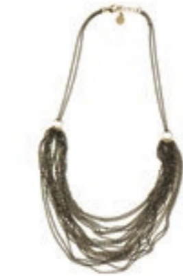
Nostalgisch und modern zugleich: mehrlagige Halskette von PIECES