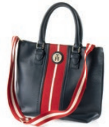
Sportivität in Leder: geradlinige Handtasche von TOMMY HILFIGER