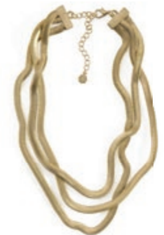
Unverzichtbares Glanzstück: wellenförmige Halskette von PIECES