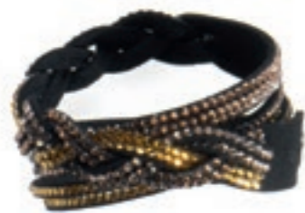
Unübersehbar trendig: Armband von KURT KÖLLN