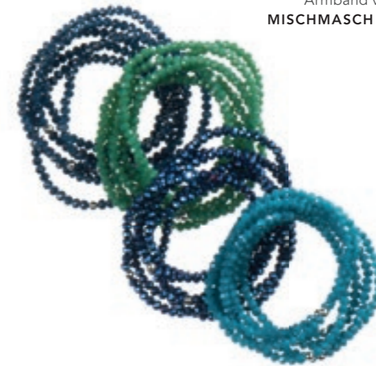
Vielfältig kombinierbar: Armband von MISCHMASCH BERLIN

Der Fokus liegt auf dem Besonderen, dem Individuellen. Schöne Accessoires sind essentielle Statements für jedes Outfit. Für modische Wertigkeit. Für Liebe im Detail. Für maximalen Style. Lassen Sie sich inspirieren.