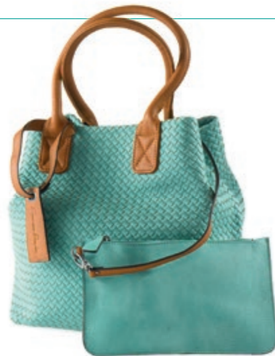
Mit verspieltem Charme: Henkeltasche in Flechtoptik mit passender Geldbörse von FRITZI AUS PREUSSEN