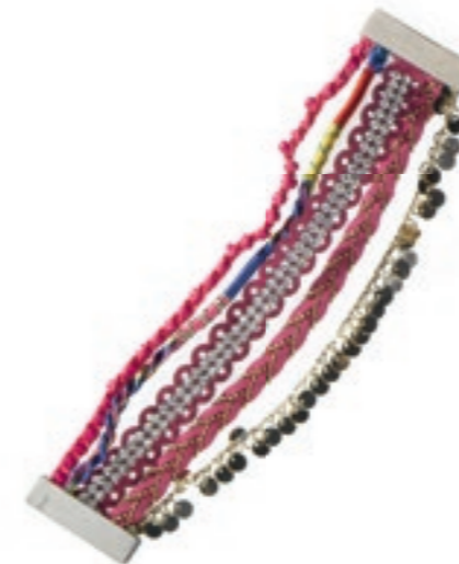
Süßes Key-Piece: Armband im Hippie-Look von MARIE LUND