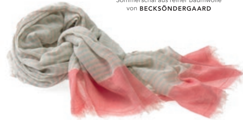
Stylt richtig auf: dezenter Sommerschal aus reiner Baumwolle von BECKSÖNDERGAARD