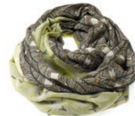
Und der Look ist komplett: Baumwollschal von PIECES