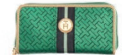
Mit sportlicher Eleganz: Clutch von TOMMY HILFIGER