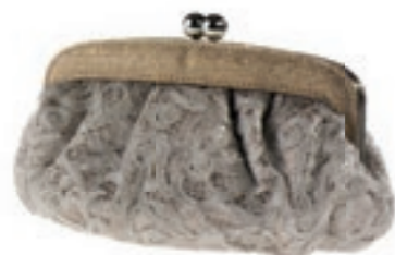
Ein Spitzen-Accessoire: niedliches Täschchen von MENBUR